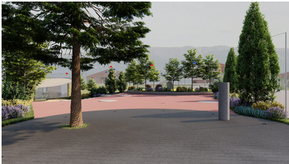
Εικ. 2: Βόρειο-ανατολική άποψη